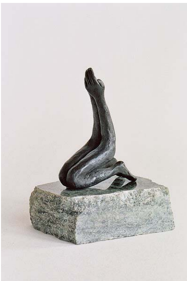
ZONDER TITEL 2003 brons, graniet