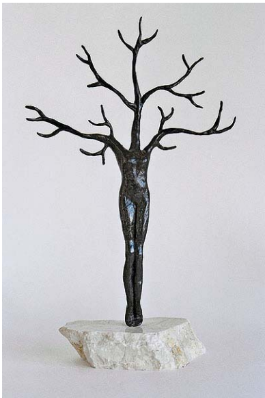
DAPHNE 2002 brons, marmer