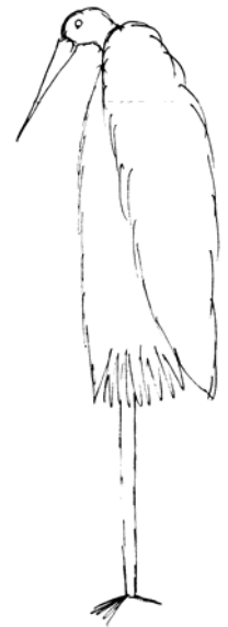
reiger (oud heertje)

Dieren waar ik het eerst aan dacht: zwaan (sierlijk, elegant) Olifant (log, maar toch elegantie)